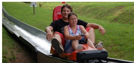
Sommerrodelbahn Braunshausen 2008 ©

Fehlt nur noch die Rückfahrt nach Merzig.