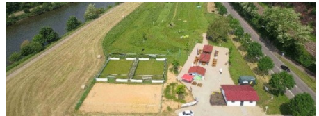
FußballGolf-Anlage aus der Vogelperspektive

Sportschuhe (es dürfen keine Stollenschuhe sein!), wettergerechte