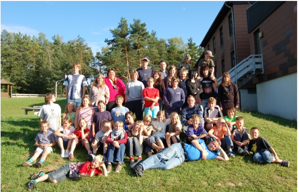
Lange her: Gruppenfoto von der ersten Ferienfreizeit in Gerolstein 2007

für Kinder und Jugendliche von 8 bis 15 Jahren