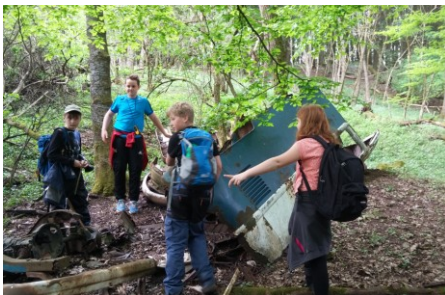
Beim Geocaching kann man sehr verrückte Sachen finden.: Hier lag ein alter Kleinbus im Wald!

Aufwärmen werden wir uns gegen Mittag bei einem nahegelegenen Fast-Food-Restaurant (nicht im Kostenbeitrag enthalten).