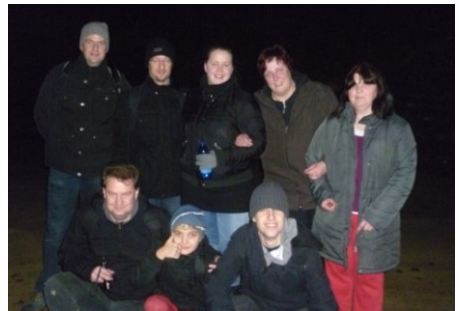
„Fette Beute“ gefunden – eine lange Geschichte ☺