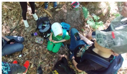
Dose gefunden – Jetzt wird der Inhalt gründlich betrachtet, geloggt und wieder versteckt.

Ausreichend Verpflegung für den ganzen Tag, wettergerechte Kleidung, evtl. Geld zum Verpflegen unterwegs.