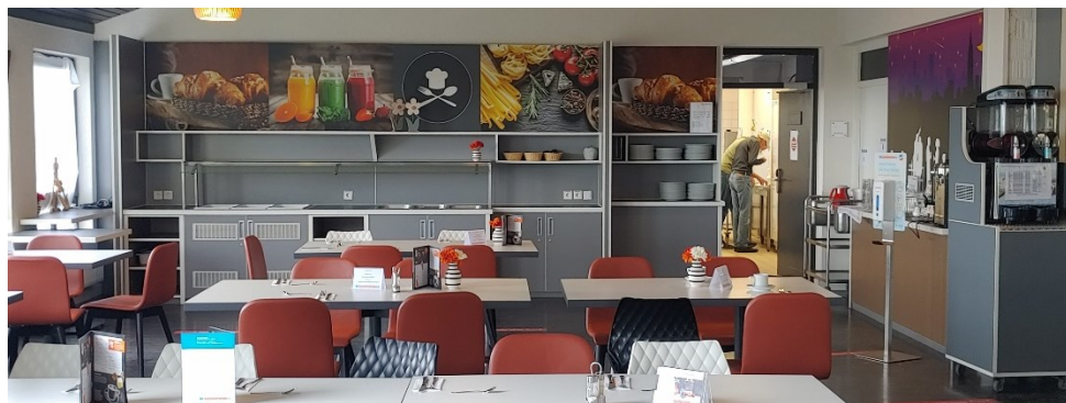
Ein Blick in den Speisesaal der Jugendherberge Wolfstein

Die Zahl der Plätze ist begrenzt und wird nach der Reihenfolge der Anmeldungen vergeben. Wer also seinen Platz sicher haben will und frühzeitig planen kann, meldet sich am besten frühzeitig an. Auf nach Wolfstein!