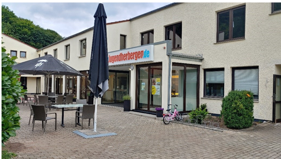
Innenhof und Eingangsbereich der Jugendherberge Wolfstein

für Kinder und Jugendliche von 8 bis 15 Jahren