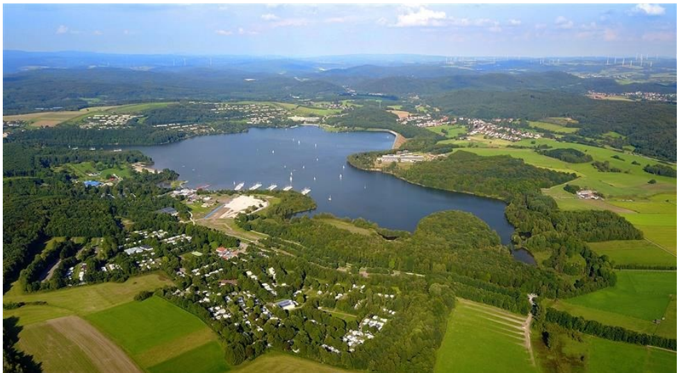
Luftaufnahme vom Bostalsee