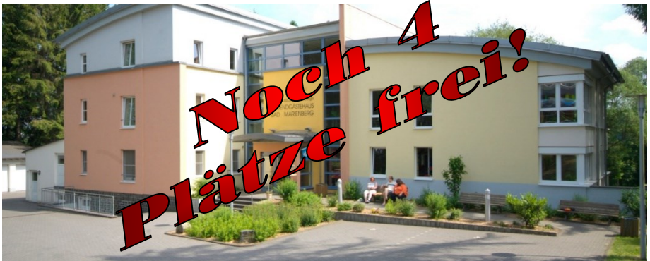
Außenansicht der Jugendherberge Bad Marienberg

für Kinder und Jugendliche von 8 bis 15 Jahren