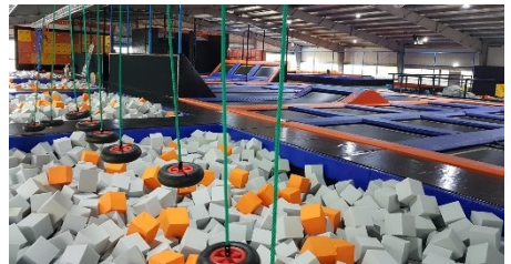
Einblicke in die Sprunghalle

Sportliche Bekleidung, evtl. Wechselkleidung, Handtuch, bei Bedarf Geld für Verpflegung. Mitgebrachte Speisen und Getränke sind in der Halle nicht erlaubt!