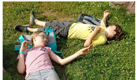
Ausruhen nach einer anderen Wanderung