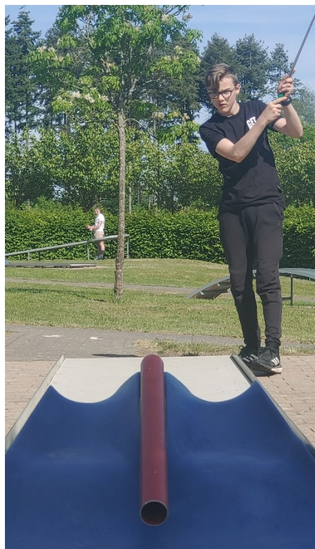
Minigolf 2022 nach dem Orientierungsmarsch

Im Kostenbeitrag enthalten ist einfach das Programm, egal wie wir uns entscheiden.