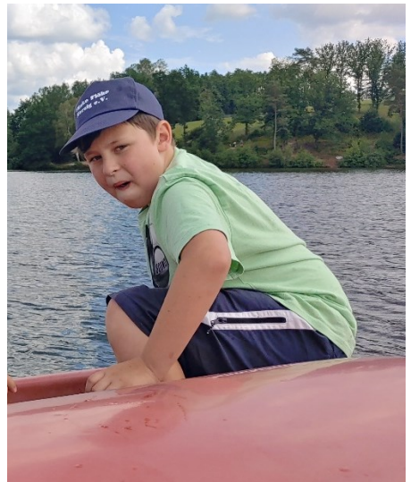
Eine Möglichkeit am See: Tretbootfahren – oder fahren lassen

Anschließend geht die Reise weiter zum Bostalsee. Was dort möglich ist? Schaut auf der rechten Seite mal nach.