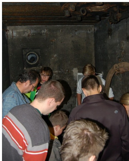
Warum schauen die bloß alle nach unten? Komm am 01.09. mit ins B-Werk und finde es heraus!

Die Führung im B-Werk ist kostenlos, Spenden sind aber willkommen. Daher bezahlen wir freiwillig 5,00 € pro Person an den Verein für Heimatkunde, der die Führung anbietet.