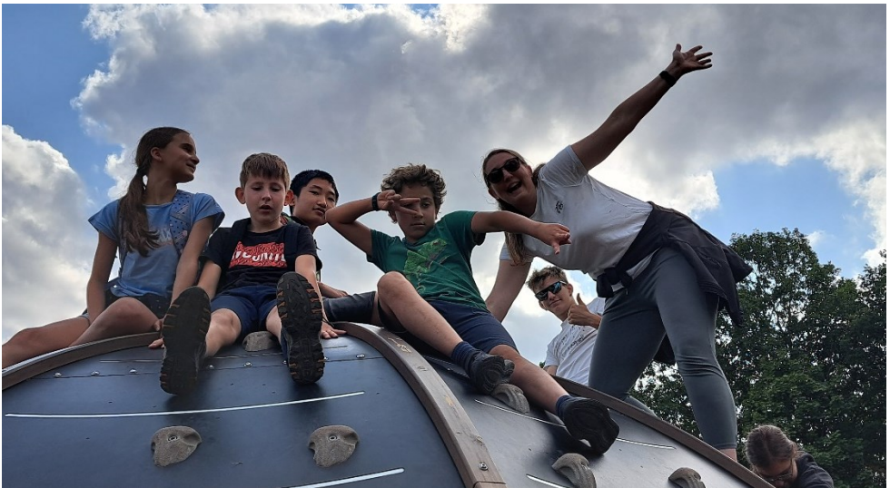
Viele Möglichkeiten zur Beschäftigung gibt es am Bostalsee, darunter dieses Klettergebäude auf dem Spielplatz.