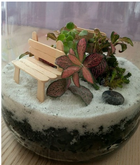
Hier ist ein Flaschengarten mit einer gebastelten Bank zu bewundern.

Mitglieder und Angehörige 18,00 € Sonstige Gäste 22,00 € Im Kostenbeitrag sind alle Materialien und Getränke enthalten.